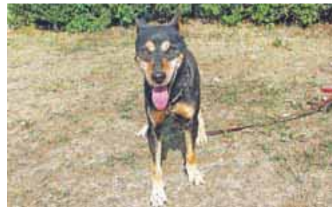
Dom išče najdenček samček mešanec. Tel: 041/666-187

Vsi, ki vas zanima zgodovina Jesenic, pohodniki, pa tudi tisti, ki ste to malo manj vabljeni na: