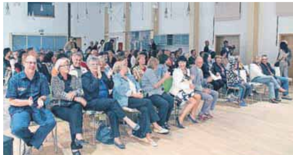
V Banketni dvorani v Kolpernu na Stari Savi so tokrat gledalci ob zadnji projekciji poletne kinoteke in predpremiero filma Adria Blues zasedli čisto vse stole.

In po kakšnem ključu so izbrali filme za letošnjo kinoteko oziroma film za zaključni večer? »Predvsem smo upoštevali želje in predloge, zbrane v anketi. Glede na tematiko predlaganih filmov, pa smo tudi sami pripravili izbor treh. Pri filmu Adria Blues so se ustvarjalci za predpremiero obrnili na lokalni kino, ki pa nam je dogodek odstopil, za kar se jim tudi zahvaljujemo.«