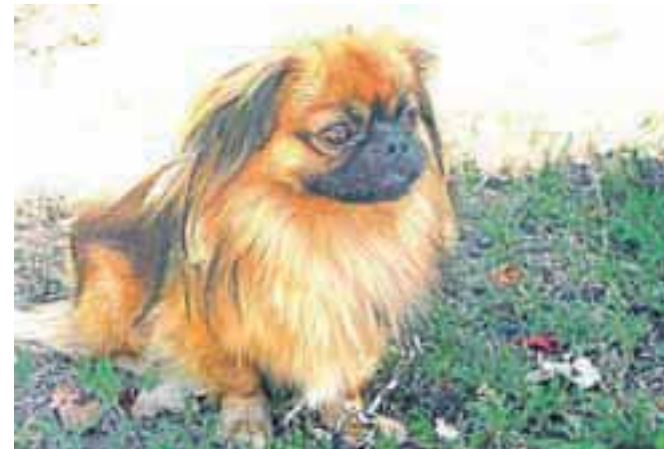
Dom išče samček najdenček pekinez. Tel: 041/666-187