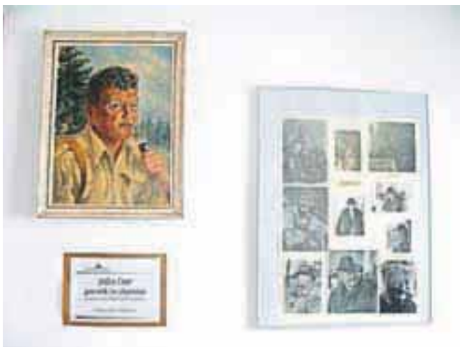
V Koči na Golici je na ogled dokumentarna razstava Irme Lipovec o Čopovih alpinističnih podvigih.