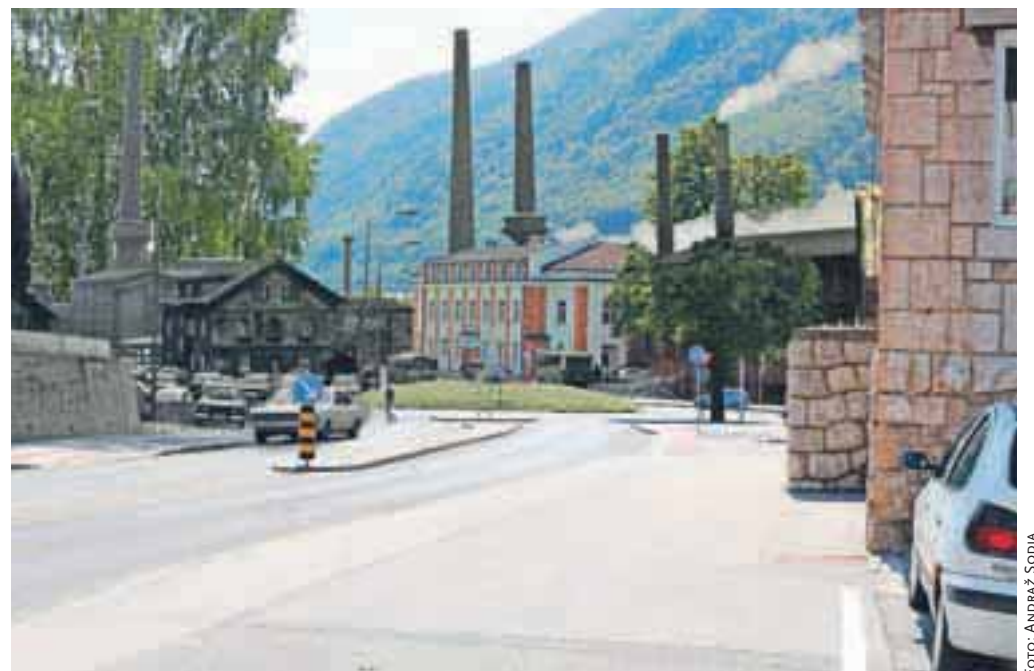
V eno fotografijo združena dva posnetka, eden iz preteklosti, eden iz sedanjosti.

OPTIKA MESEC OČESNA AMBULANTA Titova 31, Jesenice, tel.: 04/5832-663