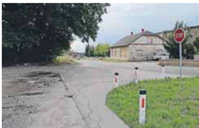
Nevarno križišče stare ceste na Koroško Belo z regionalno cesto – pred nedavnim je na tem delu umrl motorist.