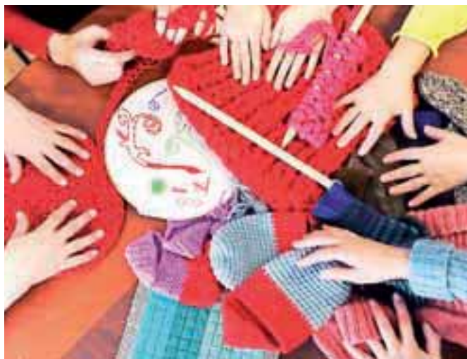
Letos se bodo udeležence učile pletenja in kvačkanja brez pletilk in kvačk.