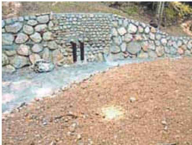
Novozgrajeno vodno zajetje na Smokuški planini

In kako je potekala preskrba s pitno vodo v letošnjem sušnem poletju? Kot so razložili v Jeko-in, so glavna vodna vira Peričnik in Završnica ter drugi manjši viri (Plavški Rovt, Javorniški Rovt, Kočna in Ajdna) za-