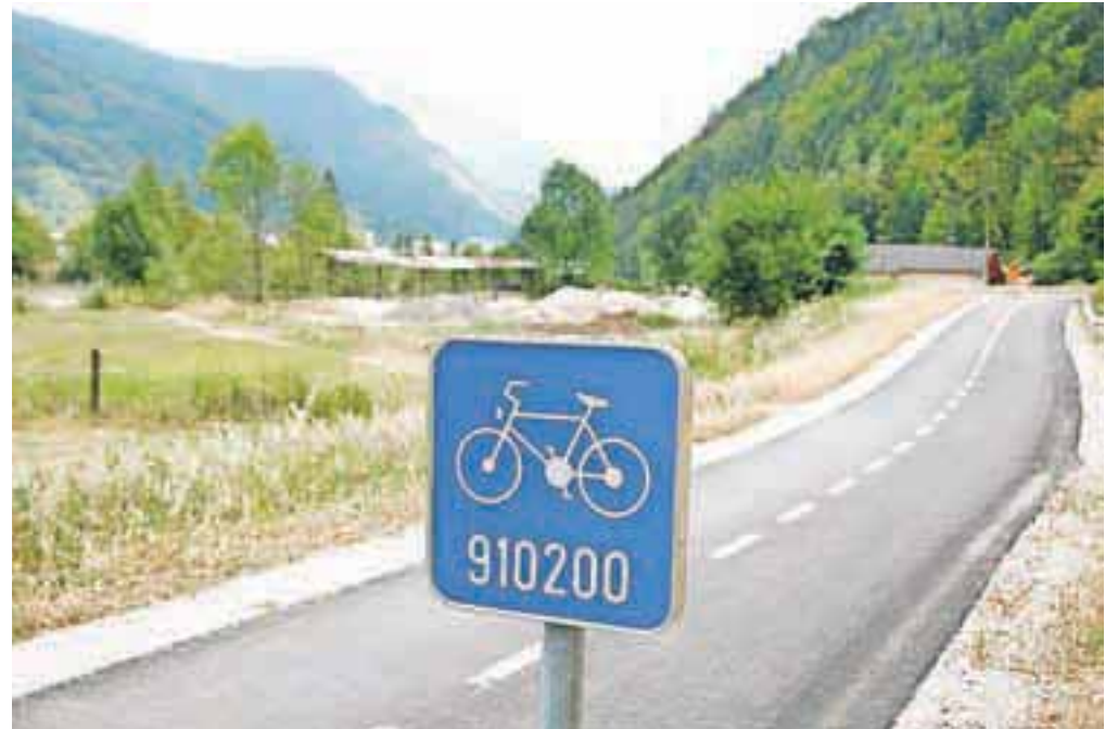
Celotna trasa kolesarske povezave skozi Jesenice je dolga trinajst kilometrov, letos bo urejena približno polovica.

Po načrtih naj bi še ta mesec končali gradnjo odseka kolesarske steze od platoja Karavanke proti Jesenicam. Trasa poteka po obstoječi makadamski poti med avtocesto in Mežaklo. Izvajalec del je Kovinar Gradnje ST, dolžina kolesarske steze, ki jo urejajo, pa je 1,1 kilometra. Gradnja sodi v sklop državnega projekta gradnje daljinske kolesarske povezave Rateče–Obrežje, projekt pa vodi Direkcija RS za ceste. Upošteva že zgrajene odseke, bo še letos urejenih približno šest kilometrov kolesarske povezave skozi Jesenice, stroški tega dela znašajo 2,2 milijona evrov, od tega je država dobila 750 tisoč evrov evropskega denarja iz sklada za regionalni