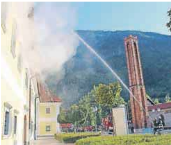
Med prikazno vajo v Kasarni so morali gasilci pogasiti požar in iz stavbe rešiti štiri ujete in poškodovane osebe.