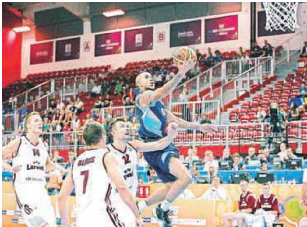
Prvenstvo sta v sredo odprli reprezentanci Latvije in BiH, slavili so Latvijci.