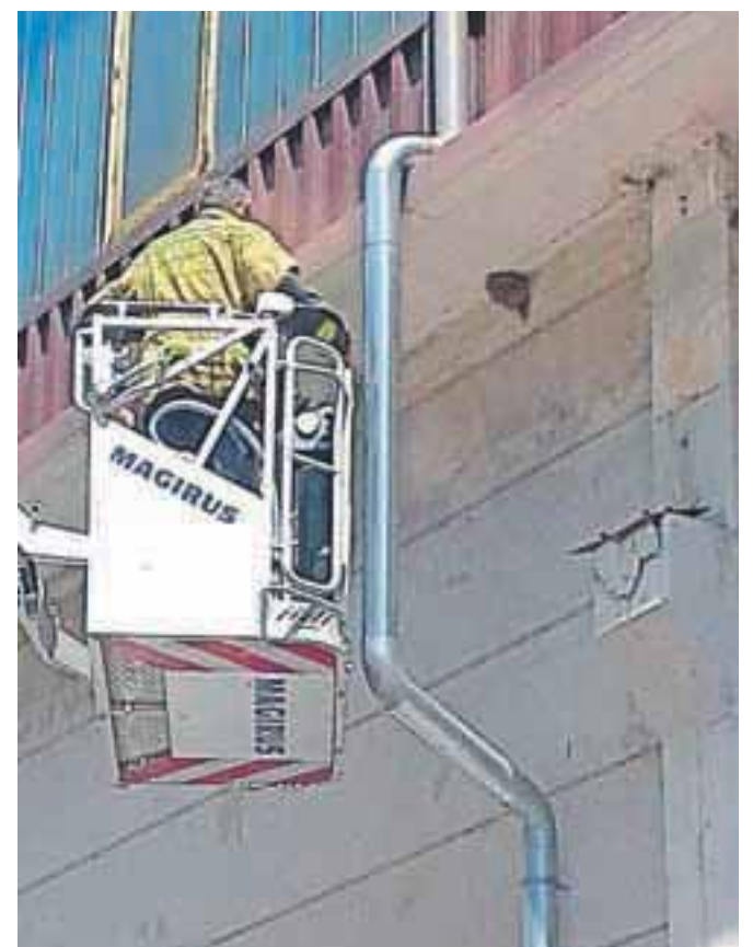
Gasilci so se z lestvijo povzpeli do gnezda in ugotovili, da ga zaradi premajhne odprtine mladiči ne morejo zapustiti.