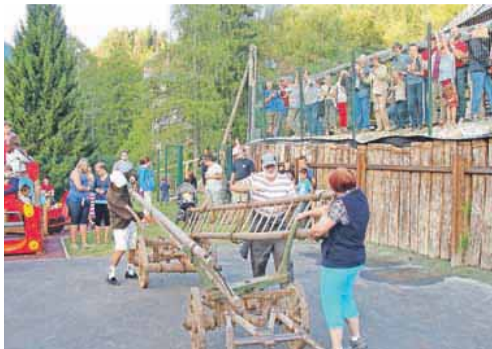
Udeleženci kmečkih iger so morali pokazati različne spretnosti, tudi pri sestavljanju kmečkega voza.